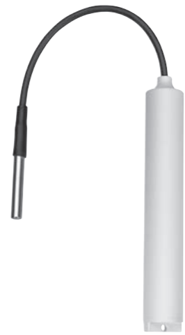
LOG-PT1000-ET030-RC / HL-RC-T030