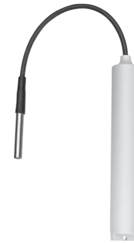
LOG-PT1000-ET030-RC / HL-RC-T030