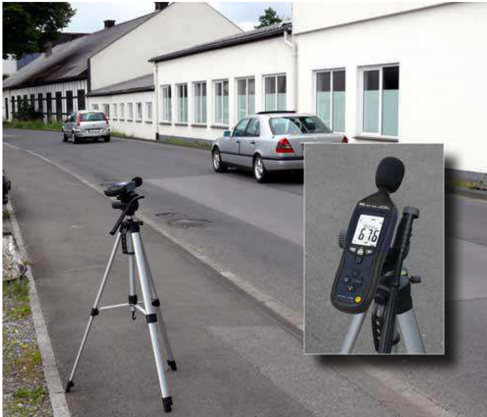
Schallmessgerät PCE-322A im Einsatz bei der Messung von Verkehrslärm (auf Stativ montiert)